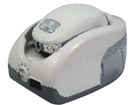
▶ P8バッテリー (バッテリー BAT8) 2日使用タイプ。駆動時間:約14~16時間