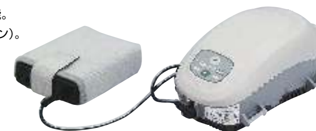
TRANSCEND AUTO + P4 Battery(Optional)