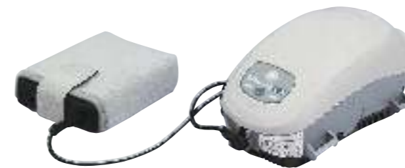
▶ P4バッテリー (バッテリー BAT4) 1日使用タイプ。駆動時間:約6~8時間

Transcendを上部にマウントして使用できる一体型加温加湿器です。CPAPからの送気を適切に加温加湿し、より快適な治療を行えます。加温加湿を併用してもなお、超小型で場所をとりません。