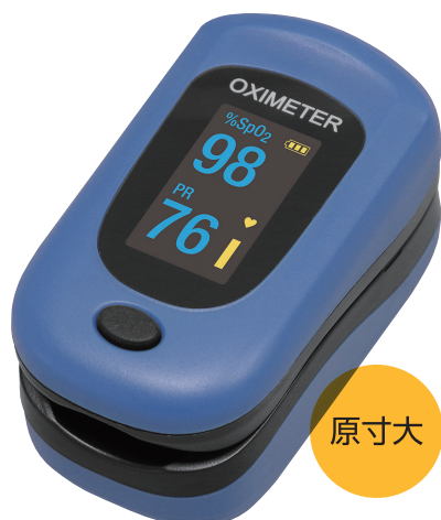
フィンガー パルス オキシメータ PC-60B1 PN：PC00033007 JANコード：4582330870851