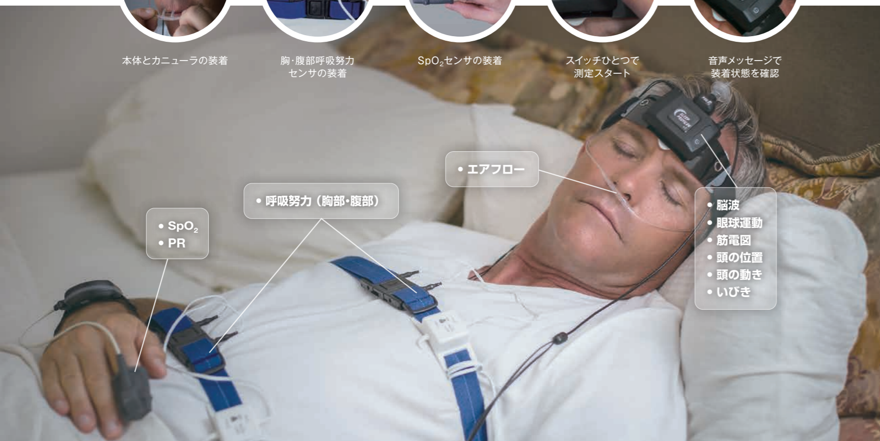
音声メッセージで 装着状態を確認